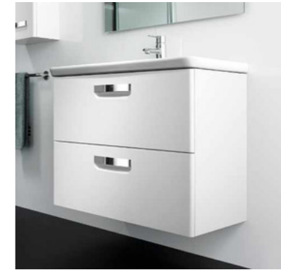
Zestaw łazienkowy umywalka z szafką Roca Gap Unik A855710576, biały