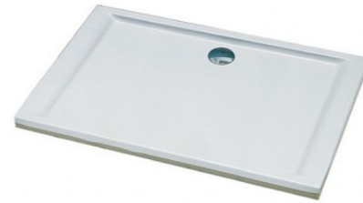
Brodzik prostokątny Koło, Pacyfik XBP0718000 akryl, 100x80 cm