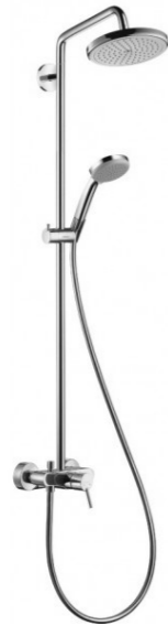
Komplet prysznicowy Hansgrohe Croma 220 z ramieniem prysznicowym 400mm