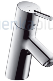
Bateria umywalkowa jednouchwytowa HANSGROHE DN15 TALIS S