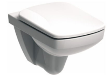
Zestaw miska WC wisząca + stelaż Koło Nova Pro 99319-000