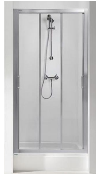
Drzwi przesuwne Sanplast Aspira II typ DTr/ASPII